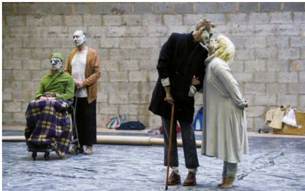
Nata Productions © Laurence Domière

Quel est le moment de l'histoire du monde que nous façonnons concrètement par chacun de nos actes ? Maguy Marin